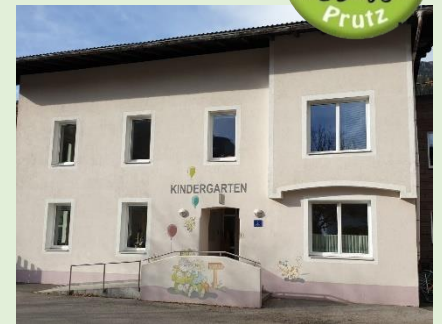
Text, Logo, Foto: Kindergarten Prutz