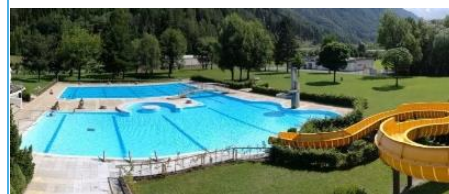
Logo, Foto: Prutzer Freizeitanlagen GmbH